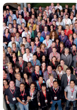
Ruim 130 FANTASTISCHE vrijwilligers!!