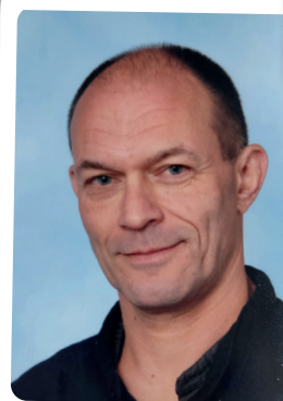
Niek Vrijwilliger Thuis- bezoeken AutoMaatje