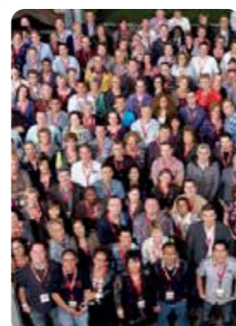
Ruim 100 FANTASTISCHE vrijwilligers!!

Op een gezellige manier oud worden in het Thuishuis Woerden