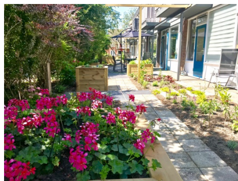
Achtertuin Thuishuis Woerden