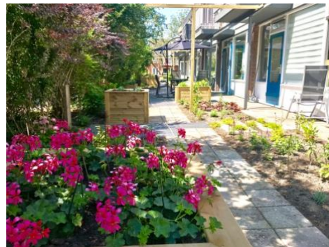
Achtertuin Thuishuis Woerden